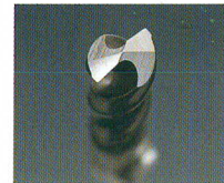
X型(クロス)シンニングの研削形状