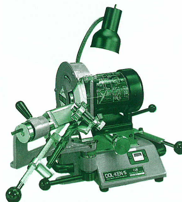
● DL-V型 研削範囲 φ13~32mm (大径テーパージャックドリル対応機) DL-V Sharpening Range φ13~32mm (For large, tapered bits)

● このカタログは改良のため、お知らせせずに仕様を変更することがあります。 ● Information in this catalog may be subject to alteration without notice.