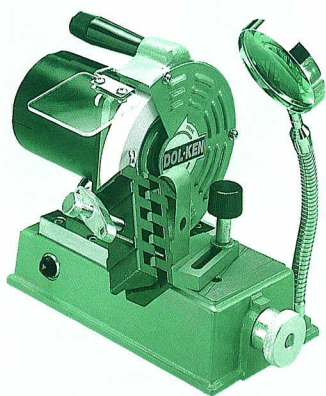
● DL-I型 研削範囲 φ2~13mm DL-I Sharpening Range φ2~13mm