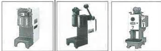
TOP-60 H-100 MA7000